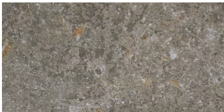
GRIS Abujardado / Bush-hammered