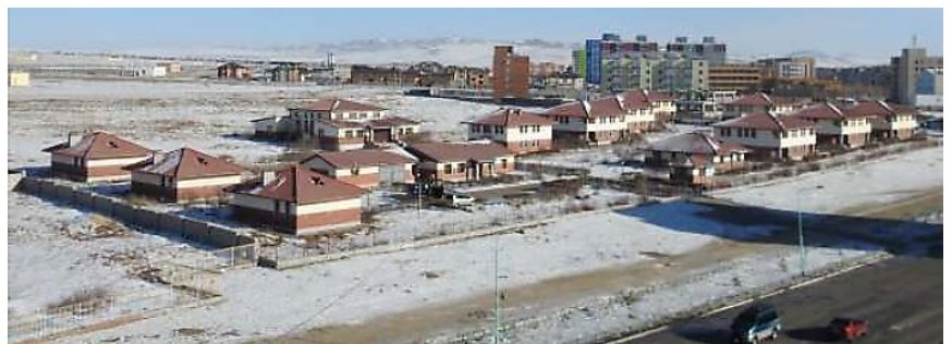
SOS-Kinderdorf Darkhan, Mongolei

2002 eröffnete in Ulaanbaatar das erste SOS-Kinderdorf in der Mongolei. Seit 2008 sind die SOS-Kinderdörfer auch in Darkhan aktiv im Einsatz. Fokus ist, gefährdeten Kindern aus der Region, die aus unterschiedlichsten Gründen nicht bei ihren Eltern aufwachsen können, ein sicheres und behütetes Zuhause zu bieten. Im SOS-Kinderdorf Darkhan leben derzeit 84 Kinder im Alter zwischen 2 und 18 Jahren (45 Mädchen und 39 Jungen). Das jüngste Kind ist noch Zuhause, 15 der Kleinsten besuchen den Kindergarten, 65 Kinder sind auf den Schulen in der Nachbarschaft und 3 Jugendliche besuchen ein Berufsbildungszentrum.