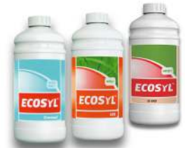
Ecosyl 100 Ecosyl 50 EKO Ecocool