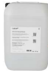
Lupro-Mix NA Lupro-Grain (NF)