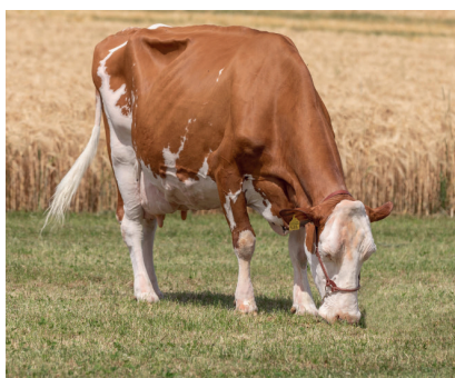
26.5 kg Lebensstagsleistung: Schürch's Coco-samba KRISTALL

Die richtige Mineralstoffversorgung ist entscheidend für die Gesundheit und Leistung von Wiederkäuern. MINEX fördert die Verdauung und Futterverwertung und sorgt somit für eine höhere Milch- und Mastleistung. Durch die gezielte Mineralisierung und Vitaminierung kann das Immunsystem gestärkt, wie auch die Fruchtbarkeit unterstützt werden. Dies wirkt sich positiv auf eine erfolgreiche Zucht