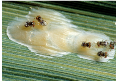
Trichogramma-Schlupfwespen auf Maiszünsler-Eiern

Zweck speziell gezüchtet und können bis zum 20. April bestellt werden. ■