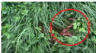
Fig. 3: Résultat sur rumex.

Intéressé par le traitement de votre parcelle? Vous souhaitez profiter du passage de la machine dans votre région? Offre limitée pour une journée par région en phase test