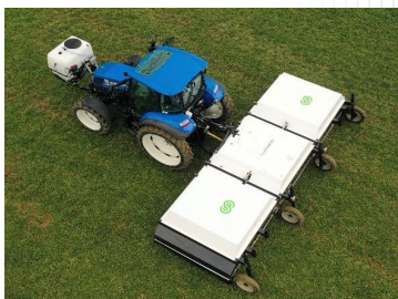
Fig. 1: Machine ARA, traitement haute précision plante par plante.