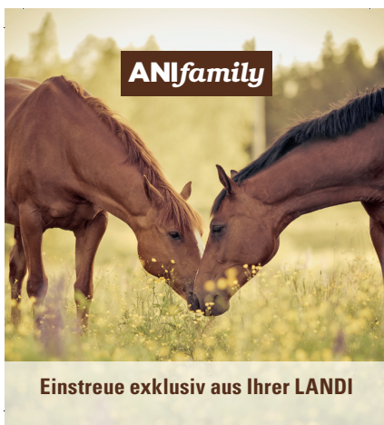
Einstreue exklusiv aus Ihrer LANDI