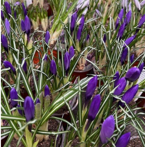
Krokusse in der LANDI St. Margrethen AG