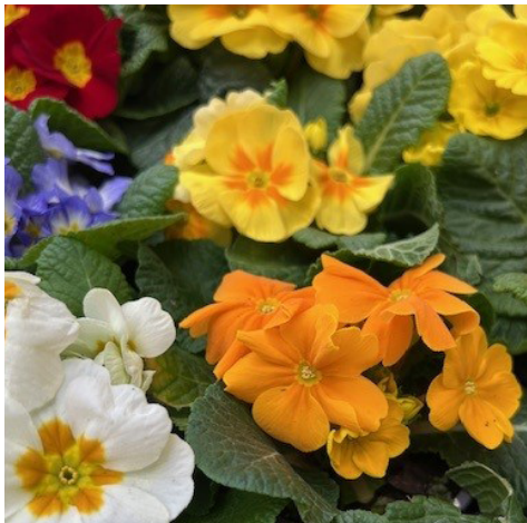
Primeln in der LANDI St. Margrethen AG

Im Kompetenzbereich Agrar verunmöglichte das schlechte Wetter in der ersten Jahreshälfte eine gezielte Übersaat im Grünland. Dies hatte jedoch den positiven Effekt, dass Pflanzenschutzmittel im Gegenzug sehr gefragt waren. Der häufige Niederschlag hat dazu geführt, dass der Pilzdruck auf den Feldern hoch war und entsprechend behandelt werden musste, damit die Kulturen geschützt werden konnten. Im Bereich Pflanzenbau konnten wir unseren Umsatz um 3.2 % steigern.