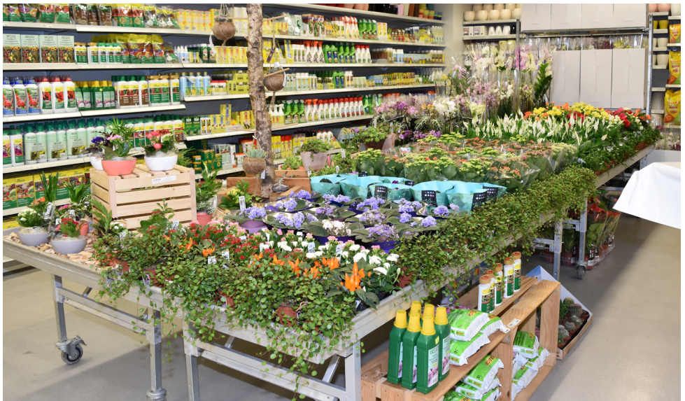
Gartenabteilung in der LANDI St. Margrethen AG