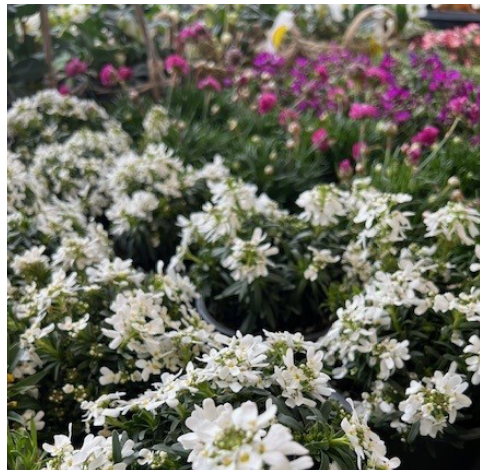
Blumen in der LANDI St. Margrethen AG