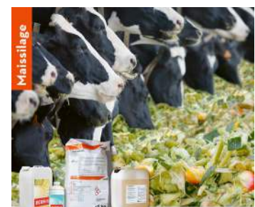
Ecocool Mais-Kofasil Lupro-Mix NA Ecocorn DA Lupro-Grain (NF)

Der Mais ist silereif, wenn die Trockenmasse im Korn einen Wert zwischen 56-60% erreicht hat. Der Trockenmassegehalt der Gesamtpflanzen sollte zwischen 29-34% liegen. Die Maissilage ist ein wichtiger Baustein in vielen Grundfütterrationen. Ziel ist es, die auf dem Feld gewachsenen Nährstoffe möglichst verlustarm und schmackhaft in die Krippe zu bringen. Hauptproblem beim Einsatz von Maissilage ist die Erwärmung und das anschliessende Verschimmeln während der Entnahme. Folgende Punkte sind zu beachten: Erntezeitpunkt, Verdichtung, Luftabschluss, Entnahmemenge und der Siliermitteleinsatz. Der AGROLINE Berater oder