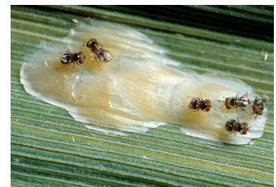
Trichogrammen auf Maiszünsler-Eiern

Wir bündeln die Trichogramma-Bestellungen und wickeln diese über unser Lager in Bünzen ab. Den damit erzielten Einkaufsvorteil geben wir in Form von günstigeren Preisen weiter. Die Preise finden Sie auf dem beigelegten Saatgutbestellblatt. Sobald der Liefertermin bekannt ist, werden Sie per SMS benachrichtigt, damit Sie die Schlupfwespen möglichst schnell ausbringen können. Profitieren Sie von unserer Sammelbestellung bis Mitte April 2025.