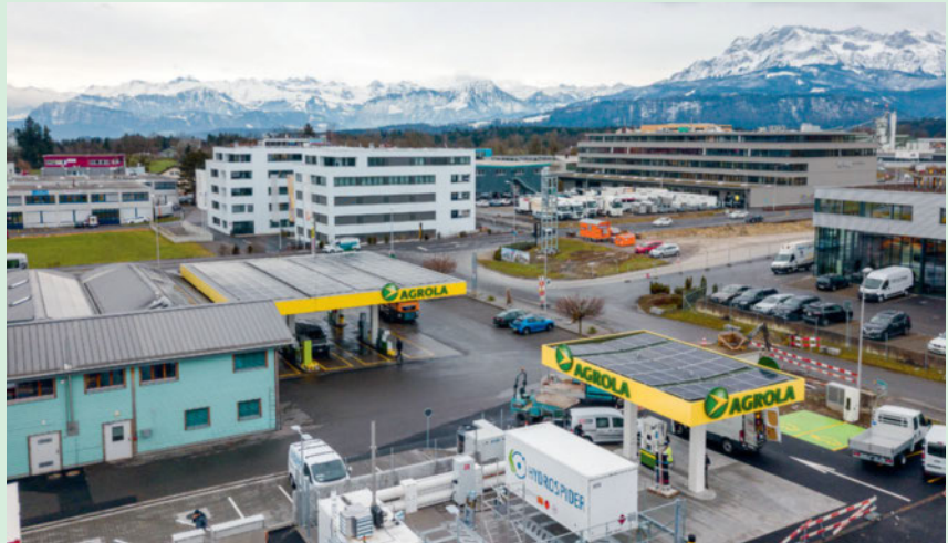
In Rothenburg kann man seit Januar 2021 Wasserstoff tanken.

SEMPACH STATION/LU Der Trend in Richtung Wasserstoff als Energieträger ist unverkennbar. Seit dem 28. Januar 2021 bietet nun die LANDI Sempach-Emmen, Betreiberin von vier AGROLA Tankstellen in der Region Luzern, an ihrer Tankstelle in Rothenburg grünen Wasserstoff an. Die Tankstelle wurde in Zusammenarbeit zwischen H2 Energy AG und der LANDI Sempach-Emmen in Rekordzeit realisiert. Es ist die zweite Wasserstoff-Tankstelle unter der Marke AGROLA und die erste im Grossraum Luzern. An der neuen Tankstelle steht ausschliesslich grüner Wasserstoff für Lastwagen und Personenwagen zur Verfügung. Mit dem Ausbau der H2-Tankstellen-Infrastruktur leistet AGROLA einen wesentlichen Beitrag zur Erreichung der Klimaziele im Rahmen der Energiestrategie 2050 des