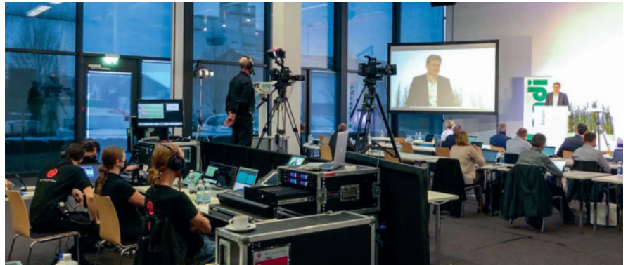
Behind the Scenes der Webinar-Aufzeichnung in Sursee.

SURSEE/LU Das Webinar zum Thema «Auswirkungen der Digitalisierung auf die fenaco-LANDI Gruppe» vom am 27. Januar 2021 diente als Ersatzveranstaltung für die Ostschweizer-tagung, die Waldstättertagung und die Präsidenten- und Verwaltungstagung in der Region Mittelland und in der Westschweiz. Während zwei Durchführungen (jene für die Westschweiz fand am Nachmittag statt) nahmen rund 400 Personen teil. Ziel des Webinars war, den Teilnehmenden