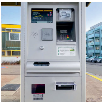
Am Tankautomat des Modells «Hectronic» kann bargeldlos bezahlt werden.

WINTERTHUR/ZH AGROLA erneuert bis Ende 2021 sämtliche Tankautomaten, um für den technischen Wandel der Zukunft gerüstet zu sein. Bereits sind über 140 neue Tankautomaten an AGROLA Tankstellen im Einsatz. Nachdem als erstes die unbemannten, sogenannten «Stand-Alone-Tankstellen» mit den neuen, modernen Tankautomaten umgerüstet wurden, sind nun die Tankstellen mit Shop an der Reihe.