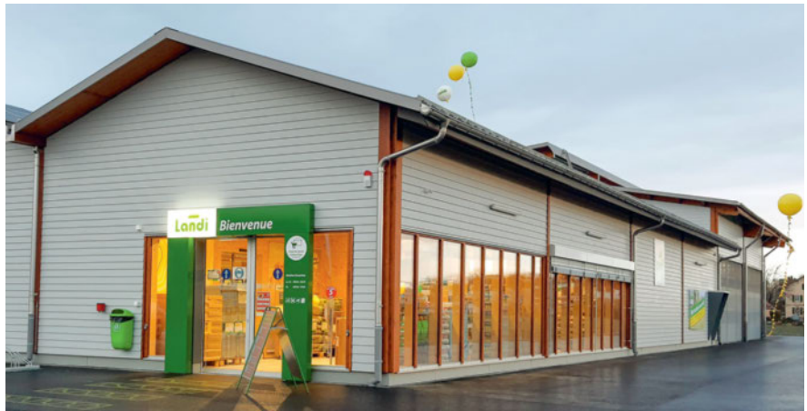
Acht Monate nach Baustart eröffnete im Januar die LANDI in Perroy.

PERROY/VD Am 21. Januar 2021 war es soweit: Nach nur acht Monaten Bauzeit wurde der neue Laden der LANDI La Côte in Perroy, an der gleichen Adresse wie bisher, eröffnet. Während der drei Eröffnungstage warteten viele Sonderangebote und verschiedene Attraktionen auf die Kundschaft. Für den Bau des 50 Meter langen und 39 Meter breiten Gebäudes wurden 380 Kubikmeter Schweizer Holz verwendet. Die Verkaufsfläche von 1115 Quadratmetern umfasst einen Innenverkaufsbereich mit Wintergartenbereich und einen überdachten und geschlossenen Aussenverkaufsbereich. In Zusammenarbeit mit den Spezialisten von LANDI Schweiz und Bolliger Söhne AG wurde das Ladenlayout übersichtlich und kundenfreundlich gestaltet. Der imposante Eingangsbereich ist ein Blickfang und beinhaltet einen grossen Vitrinenbereich. Diese Verglasung durchflutet den Verkaufsraum mit Licht und bietet Offenheit