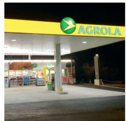
An 365 Tagen von 6 bis 22 Uhr kann man hier einkaufen.

Tankstelle in Auftrag gegeben. Im neuen TopShop werden auf einer Verkaufsfläche von 100 m 2 über 1500 Artikel des täglichen Bedarfs angeboten. Nebst sechs Betankungsplätzen für Personenwagen sind zwei AdBlue-Betankungsplätze und zwei Hochleistungszapfstellen für Lastwagen integriert. Auf dem Dach befindet sich zudem eine Photovoltaik-Anlage, die 36 kWp Strom erzeugt. Von der Gesamtproduktion werden über 80 Prozent für den Eigenverbrauch verwendet. ■