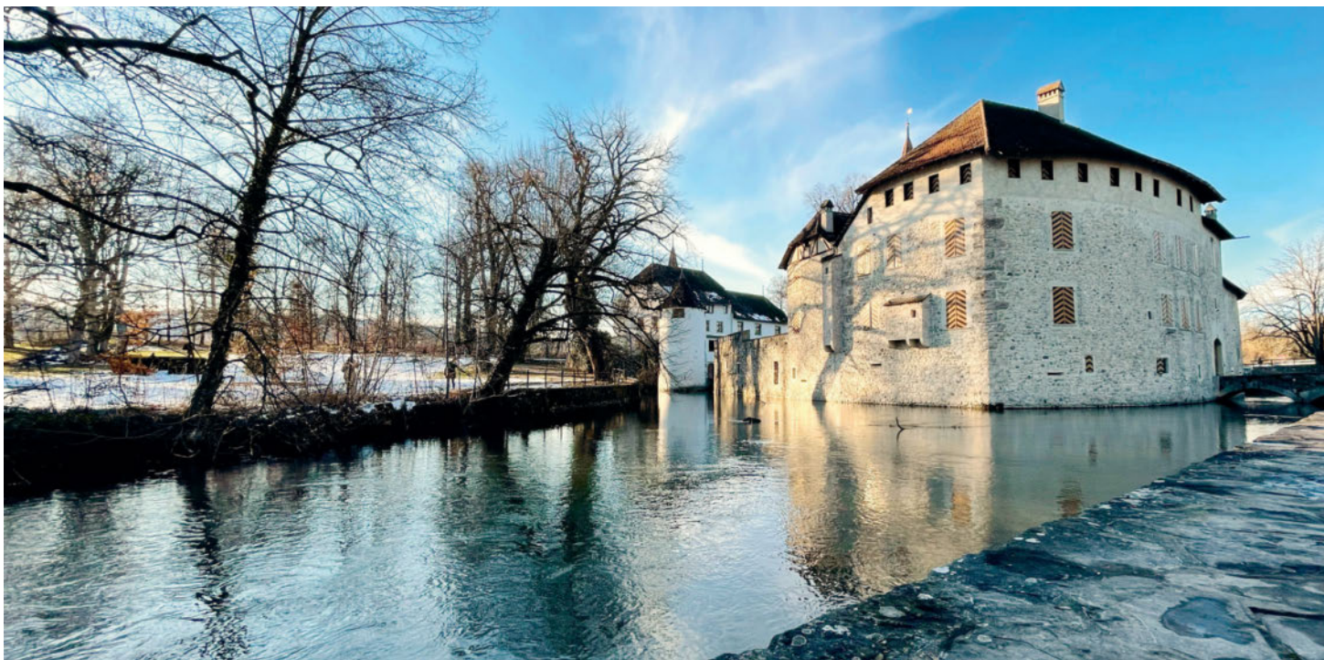
Das Schloss Hallwil unweit des Hallwilersees ist zu jeder Jahreszeit ein Besuch wert. Ab April kann man auch das Innere erkunden.

SEENGEN/AG Ganz egal, ob man selbst hoffnungslos romantisch ist oder nicht: Selten lässt jemanden der Anblick eines Schlosses wie jenes im aargauischen Seengen gänzlich kalt. Mächtig ragt das Schloss Hallwyl aus dem Aabach, seit Jahrhunderten trotz hier eine der bedeutsamsten Schweizer Wasserburgen Eroberungszügen und finanziellen Engpässen ihrer Besitzer. Bis ins 19. Jahrhundert bewohnte die Familie von Hallwyl das Schloss, heute