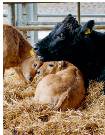
Die Büffelkühe sind Laras ganzer Stolz.

Lara will ihren Mozzarella immer weiter verbessern. Dazu fährt sie regelmässig zu einem Neuenburger Kollegen ins Val-de-Travers, der sich auf die lokale Produktion von Büffelmozzarella spezialisiert hat, um ihre Herstellungsfertigkeiten zu perfektionieren und um dort ihren Käse herzustellen. Die Räumlichkeiten in Bernex sind im Moment zu beengt, um eigenen Mozzarella produzieren zu können. «Wir möchten einen Neubau errichten, der einen Stall mit Melkstand umfasst, in dem wir 80 Büffelkühe unterbringen können. Ausserdem soll es dort eine Metzgerei, eine Käserei und einen Laden geben», erklärt Lara Graf aufgeregt. So hätten Kundinnen und Kunden die Möglichkeit, die Tiere und die Produktion zu sehen und könnten direkt vor Ort einkaufen. Zudem könnte die junge Frau ihre Aktivitäten ausbauen. «Die Idee ist, Glace, Joghurt und Käse am selben Ort herstellen zu können. Ich müsste dann nicht mehr einen Teil der Milch vor der Verarbeitung einfrieren.»