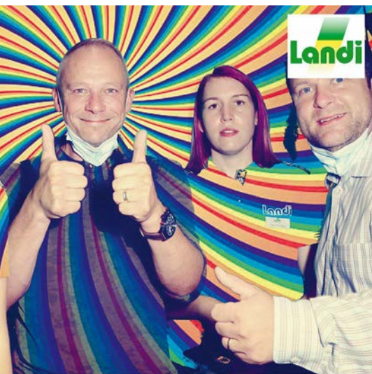
Bei der Feier zum ersten Jahrestag der LANDI Eyholz ging es bunt zu und her.

Nach der erfolgreichen Eröffnung unseres Standorts in Eyholz 2020 und des TopShops in Steg 2021 sind wir bereits an der Planung für unser nächstes Bauvorhaben. Am alten LANDI Standort in Brig möchten wir die bestehende AGROLA Tankstelle umbauen und um einen neuen TopShop erweitern. Das Baugesuch liegt derzeit der Gemeinde vor.