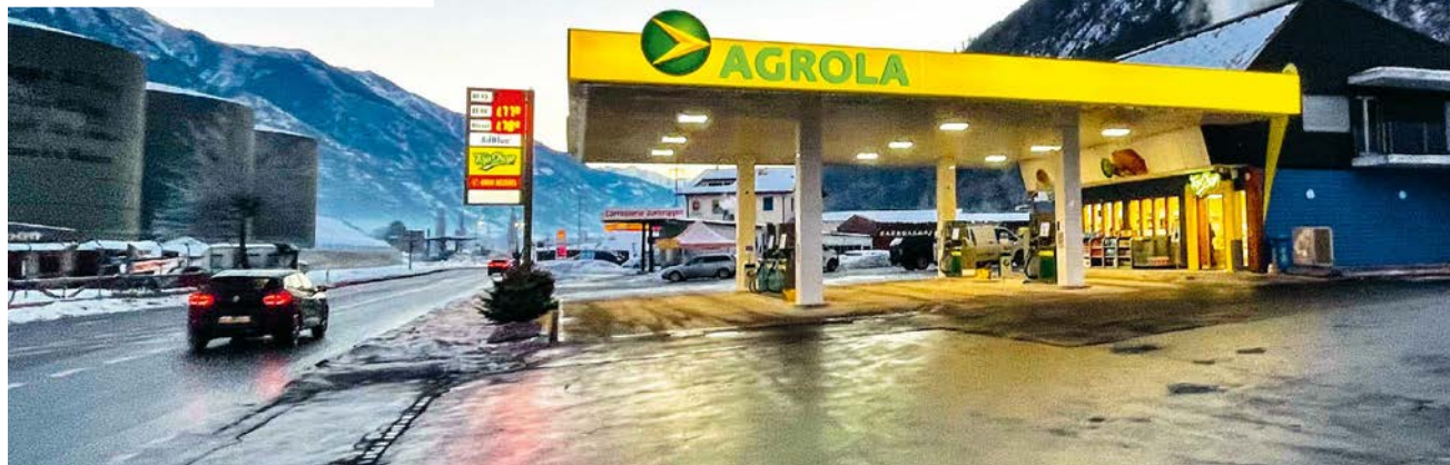
Die neue AGROLA Tankstelle mit TopShop in Steg ist ein Highlight von 2021.