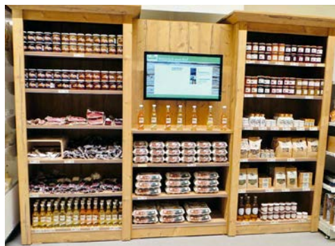
Die Produkte «Natürlich vom Hof» in unserem Laden sind sehr beliebt.