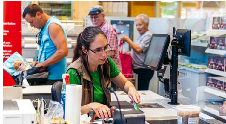
Der LANDI Laden Eyholz hat sich nach einem Jahr schon in der Region etabliert.

Die Zufahrten zu beiden Tankstellen sind ideal.