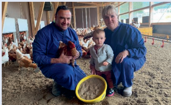
« Picnic Harmonie aide à la diversification de l'occupation des nos poules pondeuses bio. »

UFA Picnic Harmonie est disponible en bac de 11 kg, idéal pour les grands troupeaux. Le bac à picorer de 1,8 kg disponible dans les magasins LANDI.