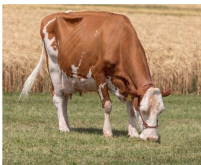
26.5 kg Lebenstagsleistung: Schürch's Cocosamba KRISTALL

Die richtige Mineralstoffversorgung ist entscheidend für die Gesundheit und Leistung von Wiederkäuern. MINEX fördert die Verdauung und Futterverwertung und sorgt somit für eine höhere Milch- und Mastleistung. Durch die gezielte Mineralisierung und Vitaminierung kann das Immunsystem gestärkt, wie auch die Fruchtbarkeit unterstützt werden. Dies wirkt sich positiv auf eine erfolgreiche Zucht