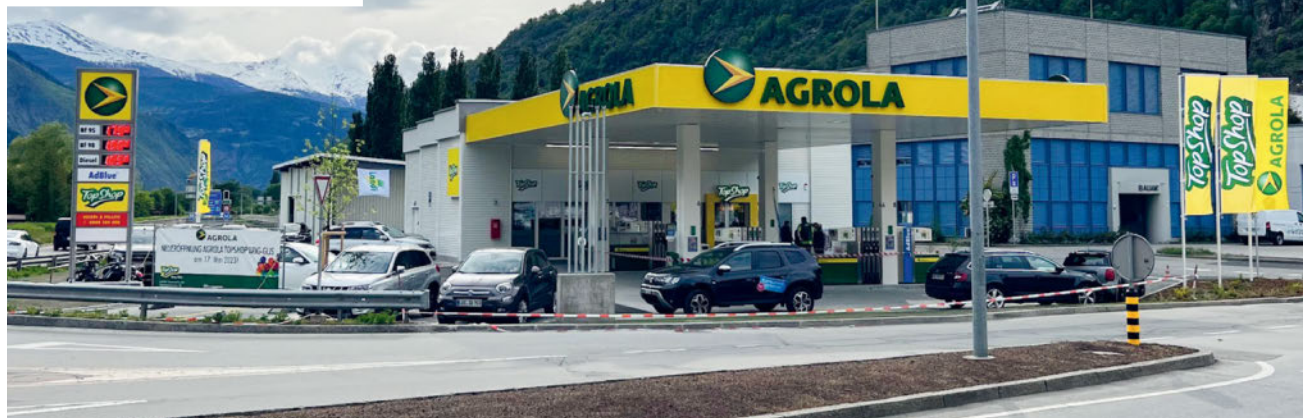
Unsere neue AGROLA Tankstelle mit TopShop am alten LANDI Standort in Brig-Glis.