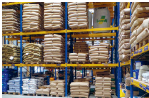
Futter im Agrarlager