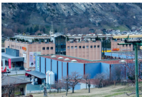
Sicht auf den LANDI Standort in Eychholz

Zusätzlich erschwerte die komplexe Situation im Pflanzenschutz, insbesondere die Regulierung der Abgabe von Spritzmitteln an Privatpersonen, die