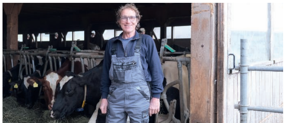
«Dank UHS kann ich standortgerecht Milch produzieren.»

bei der Fruchtbarkeit greifen. Nebst den monatlichen Auswertungen erhalten die UHS-Betriebe eine Jahresauswertung, welche sowohl die Entwicklung des Betriebs aufzeigt, wie auch den Vergleich mit Berufskollegen und Berufskolleginnen erlaubt.