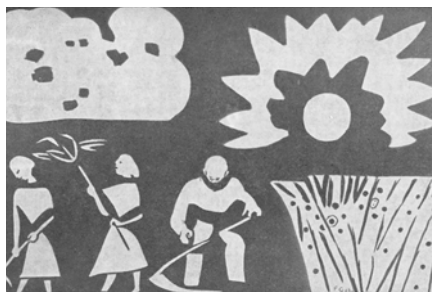
Das Sgraffito von Ferdinand Gehr.

Der Verwaltungsrat hat sich für ein Geschenk mit Symbolcharakter entschieden. Es handelt sich um eine Abbildung des Sgraffitos, das der Künstler Ferdinand Gehr 1954 an der Fassade der ehemaligen Agra Goldach geschaffen hat. Das 700 Kilogramm schwere originale Kunstobjekt wurde 2010 im Rahmen des Umbaus in den Geburtsort des Künstlers ins neue Gemeindehaus in Uzwil gebracht.