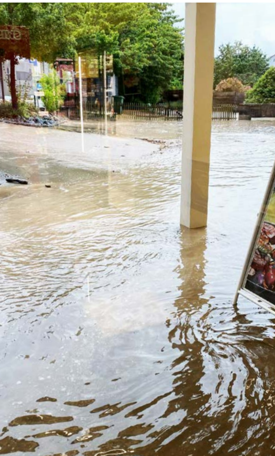
Überschwemmung vom Juli 2024.

schweizweiten Beprobung und Entschädigung ist nicht abzuschätzen. Hoffen wir im Sinne einer zukünftigen Lebensmittelproduktion in der Schweiz, dass auf Bundesebene massvolle Lösungen gefunden werden.