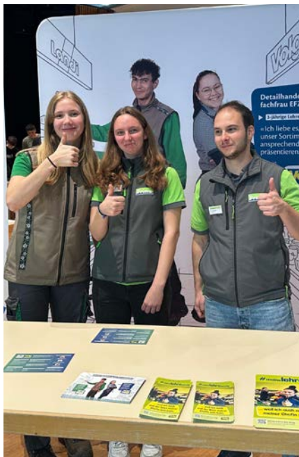
Lernende an der Tischmesse in Goldach