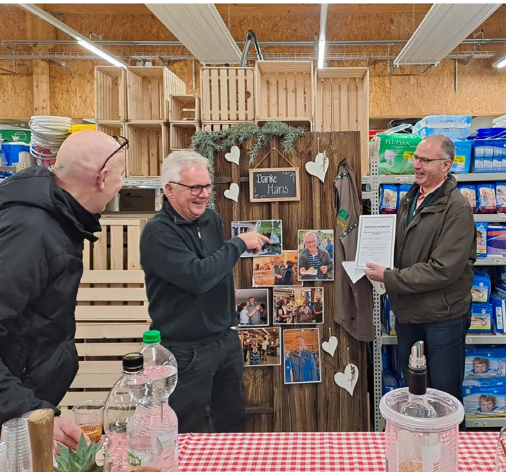
GF Verabschiedung durch VR mit Übergabe Genossenschafts-Anteilschein.