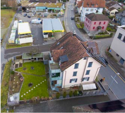
Die Liegenschaft Sulzstrasse 13.