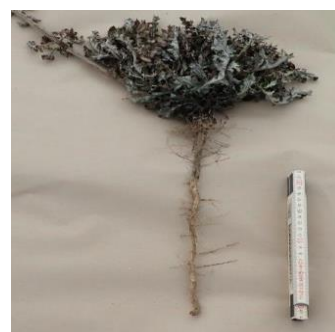
Wirkung bis in die Wurzeln

Das System erlaubt stammnahes Arbeiten und sorgt ohne Bodenbearbeitung und damit ohne Mineralisierung von Nährstoffen zu einem sauberen Ergebnis.