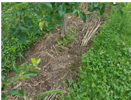
10 Tage nach Anwendung