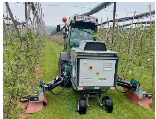
Xpower XPO Gerät im Einsatz