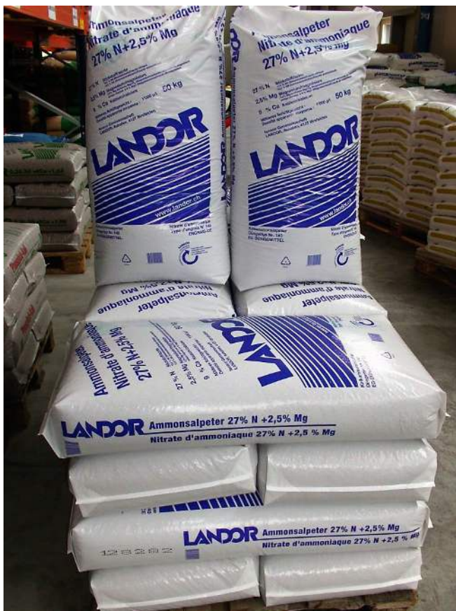
Aktion ohne MG (Symbol-Bild)

Profitieren Sie von diesem Top-Preis, beim Bezug von mindestens 1 Pal. (Bezug nur Palettenweise möglich) mit Abholung ab Alpnach