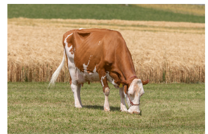
Schürch's Cocosamba KRISTALL, 26,5 kg Lebensstagsleistung