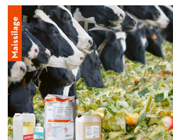
Ecocool Mais-Kofasil Lupro-Mix NA Lupro-Grain (NF)

Der Mais ist silereif, wenn die Trockenmasse im Korn einen Wert zwischen 56-60% erreicht hat. Der Trockenmassegehalt der Gesamtpflanzen sollte zwischen 29-34% liegen. Die Maissilage ist ein wichtiger Baustein in vielen Grundfütterationen. Ziel ist es, die auf dem Feld gewachsenen Nährstoffe möglichst verlustarm und schmackhaft in die Krippe zu bringen. Hauptproblem beim Einsatz von Maissilage ist die Erwärmung und das anschliessende Verschimmeln während der Entnahme. Folgende Punkte sind zu beachten: Erntezeitpunkt, Verdichtung, Luftabschluss, Entnahmemenge und der Siliermitteleinsatz. Der AGROLINE Berater oder