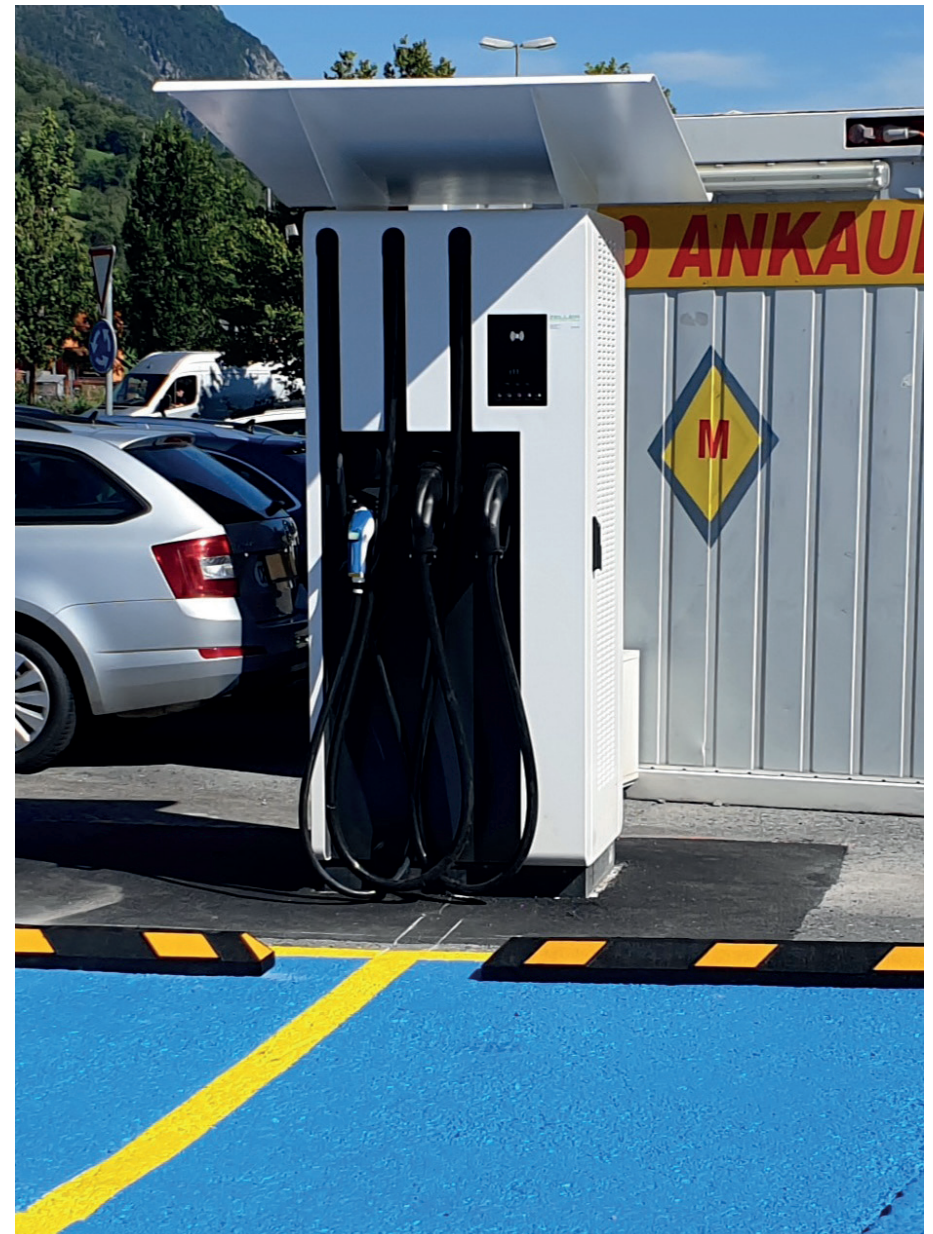
Elektro-Ladestelle, LANDI Sarganserland AG