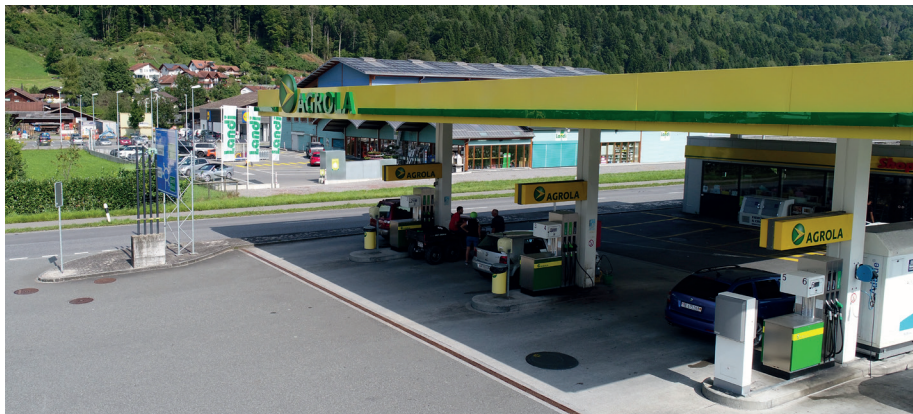
Aussenansicht LAVEBA Shop Flums & AGROLA Tankstelle