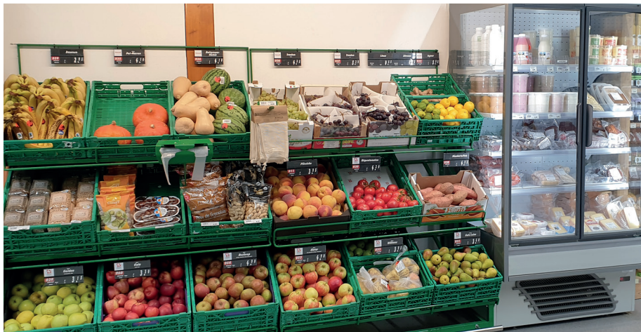
Saisonales Früchte- und Gemüse-Angebot