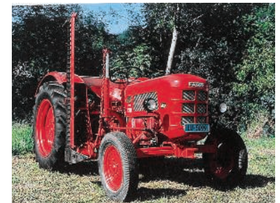
Fahr-Dieselschlepper D 133 N