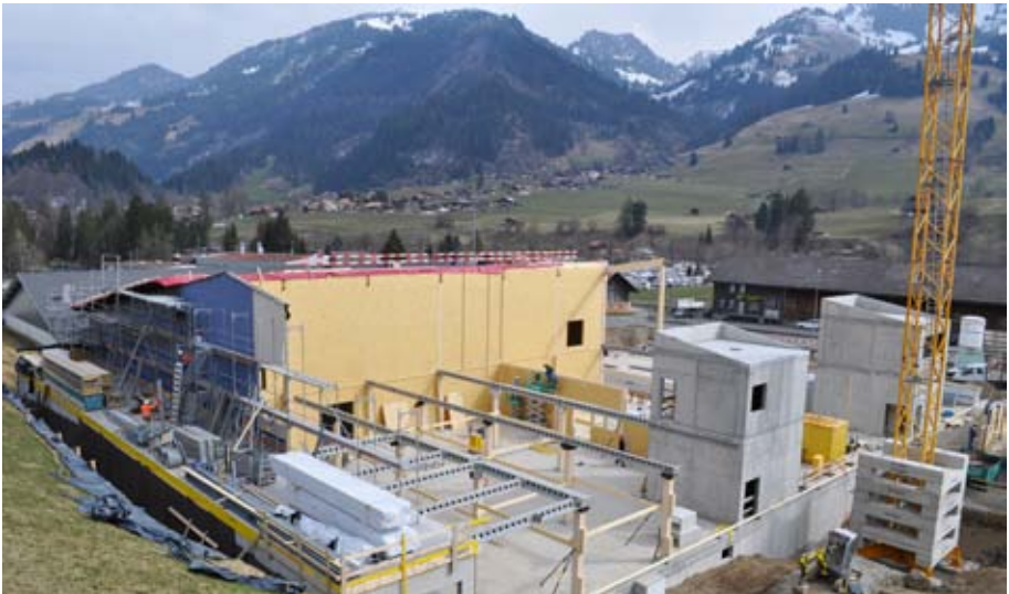
Neubau in Zweismimmen.

* Lernende der LANDI SIMMENTAL-SAANENLAND