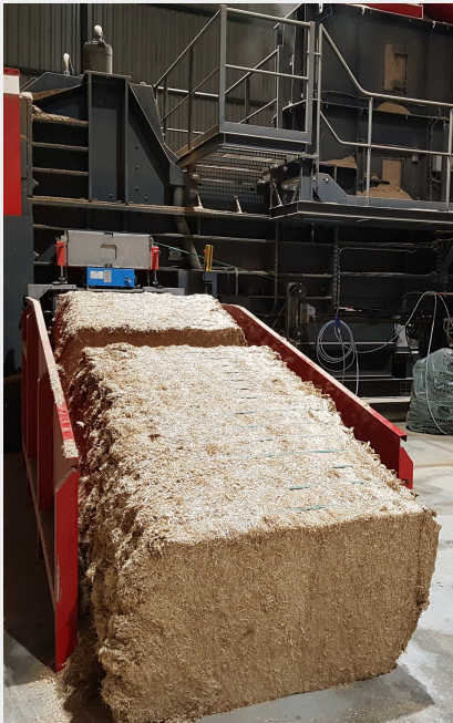
Die neue Qualitätsgeneration

An der Côte d'Ôr in Frankreich wird in einer nach modernsten Massstäben installierten Produktionsanlage das exklusiv für die fenaco-LANDI Gruppe kreierte Markenprodukt ANlbric Strohhacksel produziert.