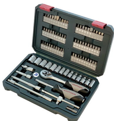
1 coffret de clés à douilles UFA

dès l'achat de 200 kg composés minéraux MINEX/UFA valable jusqu'au 18.11.22