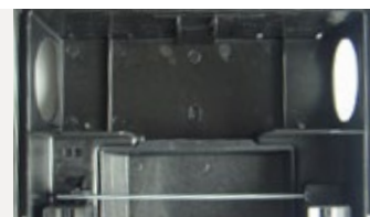
Rattenköderstation Sintagro