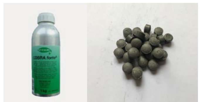
Cobra Forte

Zurzeit ist Cobra Forte das einzige Produkt, das zur Bekämpfung von Wühlmäusen und Maulwürfe im Feld-, Obst-, Wein- und Gemüsebau bewilligt ist. Die Pellets werden in die Gänge der Mäuse gelegt. Anschliessend müssen die Auslegestellen gut verschlossen werden, der Gang darf allerdings nicht verschüttet werden. Das Gas (Phosphorwasserstoff)