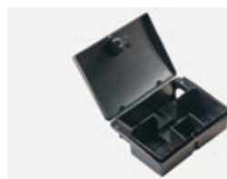
Mäuseköderstation Sintagro