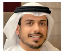
Son Excellence Sheikh Sultan bin Tahnoon Al Nahyan, Membre du Conseil exécutif d'Abu Dhabi