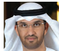
Son Excellence le Dr Sultan Ahmad Al Jaber Envoyé spécial des Émirats arabes unis pour le changement climatique, ministre de l'industrie et des technologies avancées, directeur général du groupe ADNOC et président de Masdar.