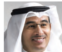
Son Excellence Mohamed Alabbar, Fondateur et directeur général d'Emaar Properties PJSC

See Appendix for biographies of Higher Committee members.