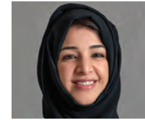
Son Excellence Reem Ebrahim Al Hashimy Ministre d'État des EAU pour la coopération internationale et directrice générale d'Expo 2020 Dubaï