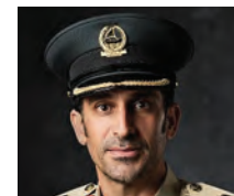
Son Excellence le lieutenant General Abdullah Khalifa Al Marri Commandant en chef de la police de Dubaï