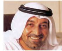
Son Altesse Sheikh Ahmed bin Saeed Al Maktoum, Président de l'Autorité de l'aviation civile de Dubaï, président et directeur général de la compagnie aérienne et du groupe Emirates, et président du Haut Comité d'Expo 2020 Dubaï