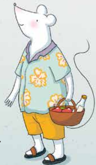
BRUNO KAUFT .....

Illustration von Ruth Cortinas → ruthcortinas.ch .