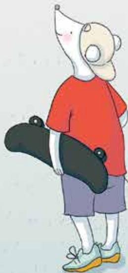
EVI KAUFT .....