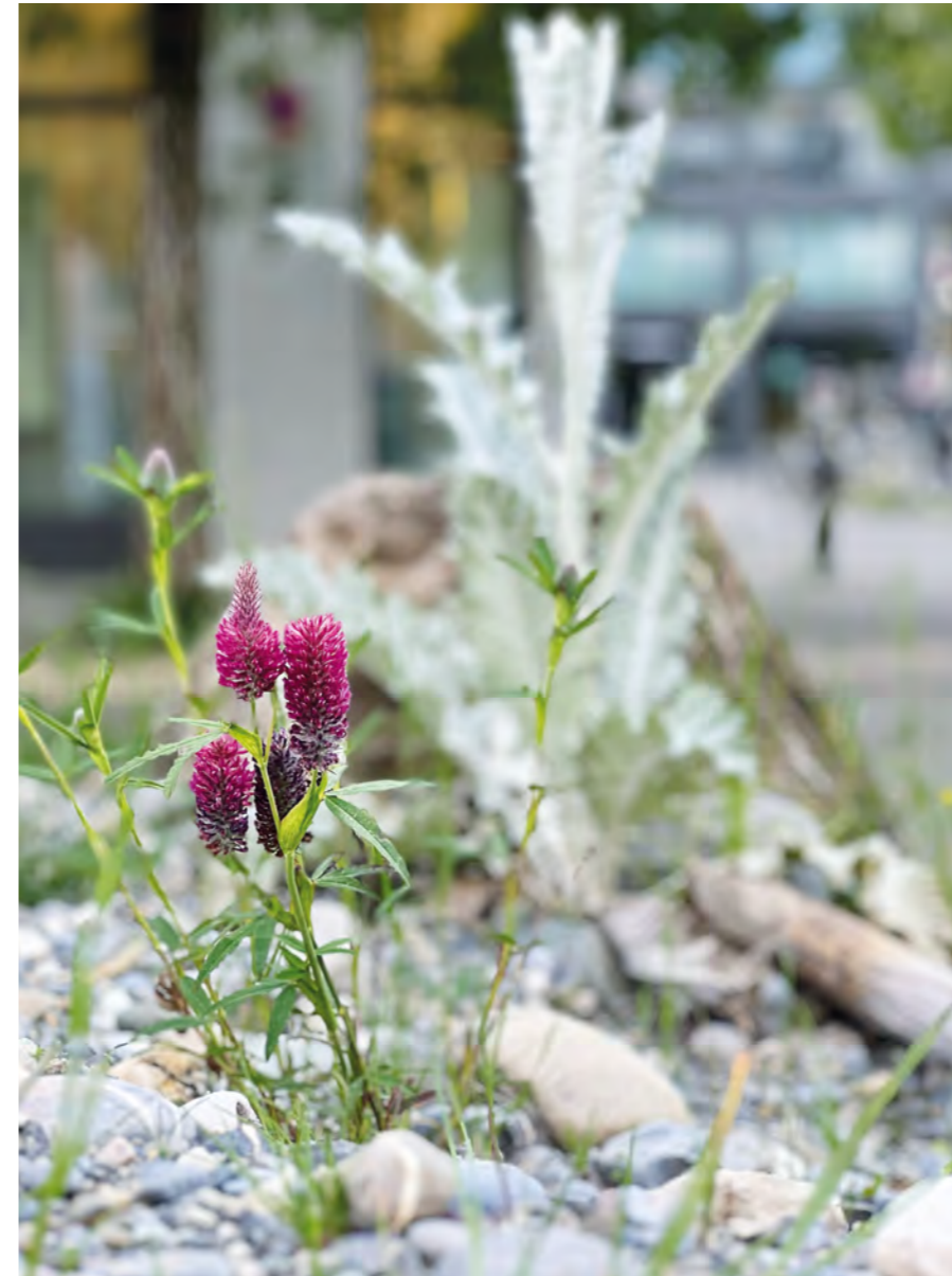
Rückeroberung - Ist der Asphalt weg, eröffnen sich Chancen für Flora und Fauna.