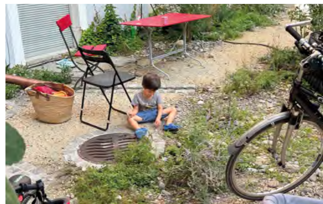
Entsiegelte Böden laden zum Spielen ein.