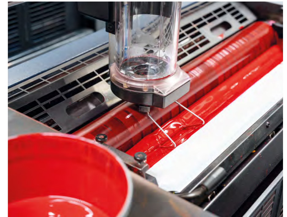
Druckfarbe aus Eigenproduktion, mit für Mensch und Umwelt unbedenklichen Inhaltsstoffen und «Cradle-to-Cradle»-zertifiziert.

Als ihr bisheriger Farblieferant mitteilte, aus dem Business auszusteigen, entschied sich die Vögeli AG, die Rezeptur zu kaufen, die Farben selber zu produzieren und sie neu zertifizieren zu lassen. Die erhaltene Gold-Zertifizierung bestätigt, dass alle Inhaltsstoffe unbedenklich sind. Dieser Gesundheitsaspekt und der Wunsch, genau zu wissen, was in den Farben drin ist, war ein wichtiger Faktor für den Entscheid in die Farbproduktion einzusteigen. Daneben spielte es selbstverständlich auch eine Rolle, dass die Farben in technischer Hinsicht