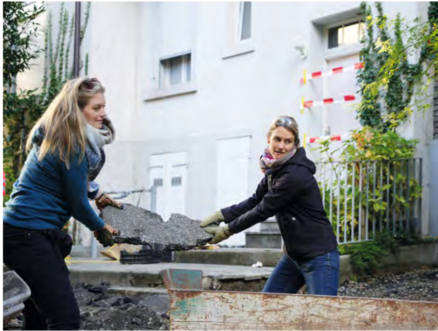
Der aufgebrochene Asphalt wird abtransportiert.