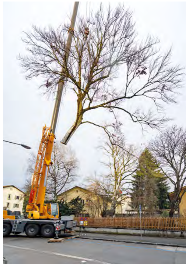
Die abgesägte Baumkrone schwebt durch die Luft.

Nach dem erfolgreichen Abschluss der ersten Etappe im Spätherbst, gehen die Instandsetzungsarbeiten in der «Indu 3» seit April weiter mit dem Blockrand Röntgen- und Heinrichstrasse. Der mit der Photovoltaik-Anlage auf dem Dach produzierte Solarstrom wird ins Netz eingespeist und von ewz rückvergütet. Ziel ist, dass Ende Jahr, wenn die Arbeiten abgeschlossen sind, der sogenannte Solarsplit umgesetzt wird. Das heisst: Die BEP als Besitzerin der PV-Anlage verkauft den umweltfreundlich erzeugten Solarstrom via ewz ihren Mieter:innen gemäss deren Verbrauch. Der auf dem eigenen Dach produzierte Solarstrom ist aus Gründen der Nachhaltigkeit attraktiv, und er ist auch attraktiv für die Mieter:innen, denn sie erhalten ihn zum günstigsten ewz-Tarif.