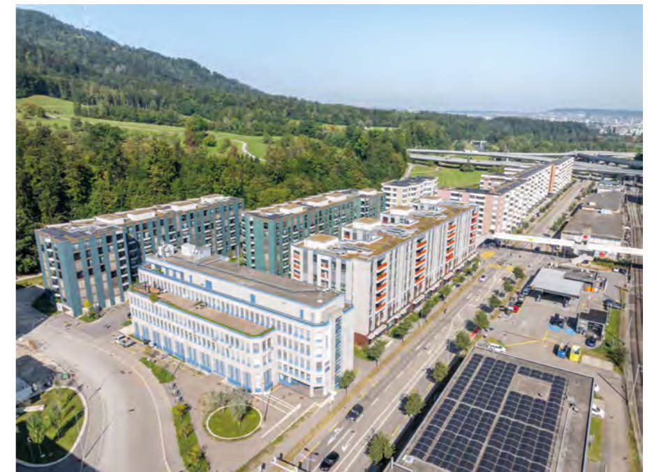
Die Gewerbeliegenschaft Manegg 2, erkennbar an den hellblauen Fenstersimsen, vorne quer im Bild; rechts davon mit den orangen Balkonbrüstungen die BEP-Siedlung Manegg 1.

Der Bereich Bau und Entwicklung bzw. die BEP-Baukommission hat entschieden, dass bei der Umnutzung der Manegg 2 der Absenkpfad mit Zusatzanforderung A verfolgt werden soll. Dieser Absenkpfad ist steiler und besonders ehrgeizig, denn mit ihm soll «Netto-Null» bereits im Jahr 2040 erreicht sein. Massnahmen, um dahin zu gelangen, sind unter anderem: