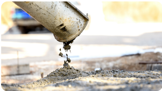
Béton de consistance S2-S3