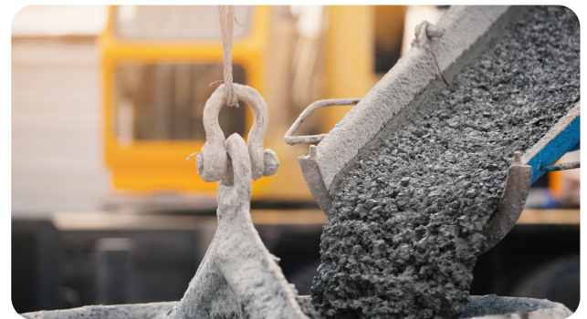
Béton de consistance S4