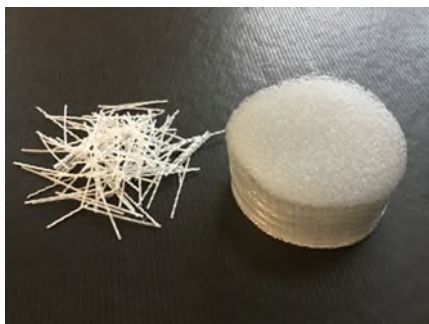
Macro fibre in polipropilene MasterFiber I56 SPA

In ottemperanza al Regolamento Europeo (EU No 305/2011 e EU No. 574/2014) il prodotto risulta essere provvisto di marcatura CE secondo UNI EN 14889-2 e delle relative DoP (Dichiarazione di Performance).