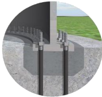
Derin Boşluk Tasarımı