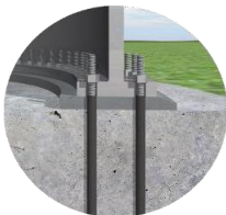
Taban Plakası Tasarımı