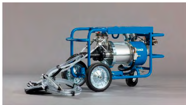
Przykładowa dwuskładnikowa pompa wtryskowa

Aby uzyskać optymalne mieszanie składników podczas wtrysku i wypełniania pustych przestrzeni, zdecydowanie zaleca się zastosowanie mieszadła statycznego przepływowego w połączeniu z głowicą mieszającą. Długość mieszadła statycznego powinna wynosić około 32 cm.