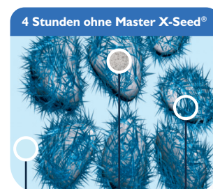
4 Stunden ohne Master X-Seed®