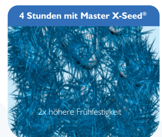
4 Stunden mit Master X-Seed®