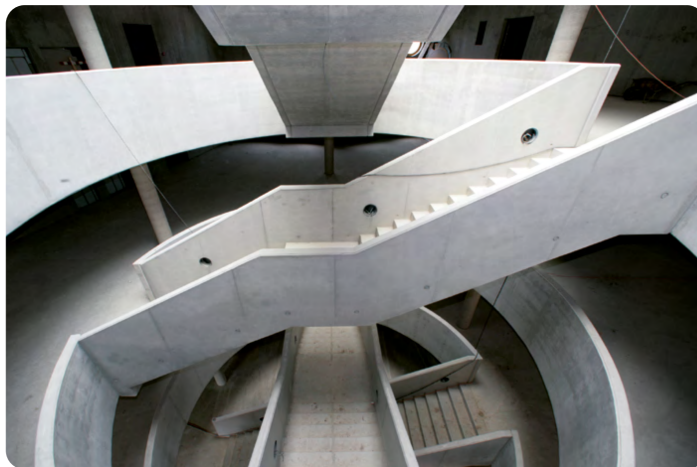
Nasze referencje w Hradec Králové (Czechy): biblioteka, w Hradec Králové