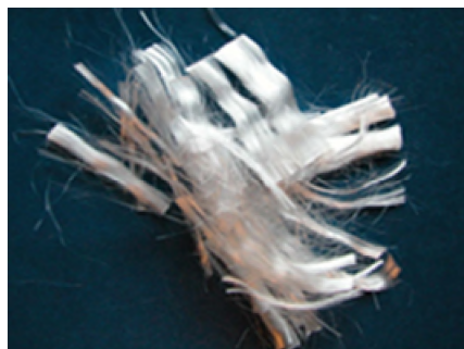
Micro fibre sintetiche MasterFiber 018

contribuiscono ad ottenere un conglomerato cementizio più durevole in quanto esente da fessurazioni e quindi maggiormente resistente all'attacco di aggressivi.