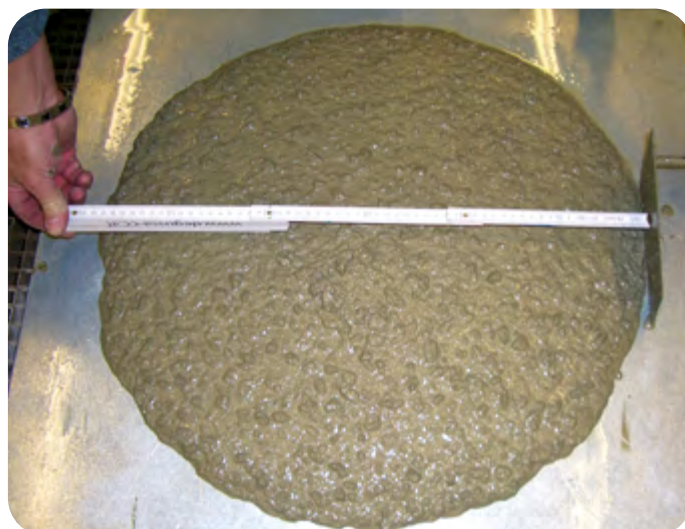
Badanie jakości betonu natryskowego

W związku z rosnącym wykorzystaniem betonu natryskowego jako stałego materiału konstrukcyjnego do obudów tunelowych wzrosły również wymagania dotyczące jego trwałości. Materiał ten zapewnia większą elastyczność pod względem geometrii i wymagań przestrzennych. Wytrzymały beton natryskowy jest niezbędny do stworzenia innowacyjnej formuły obudowy tunelowej o strukturze kompozytowej (patrz strona 8).