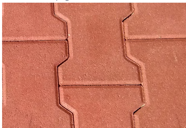
Powierzchnia impregnowana MasterPel SP 6200