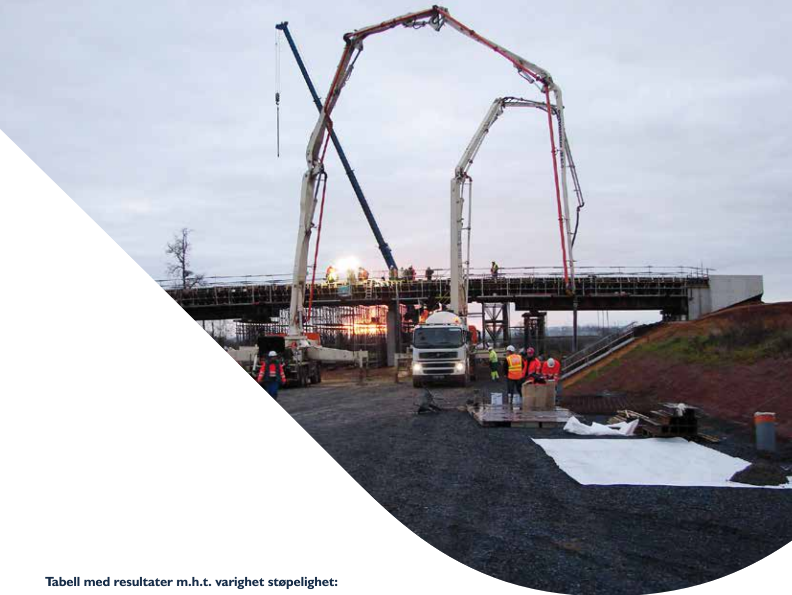
Tabell med resultater m.h.t. varighet støpelighet: