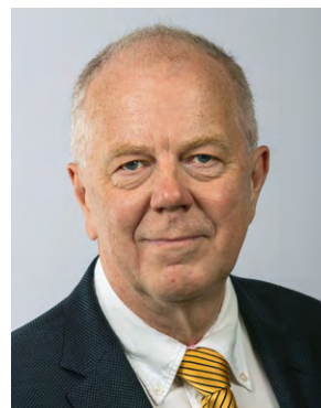
Олле Далин Президент IBU