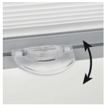
Klappbarer Kunststoffgriff nur bei Stoffpreisgruppe E