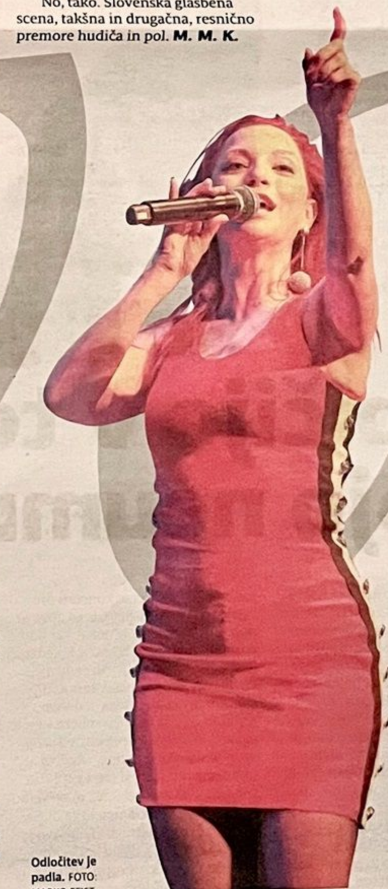
Odločitev je padla.

Bil je izjemno navdušen nad mojo drznostjo, ker sem poslal komaj 48 sekund dolgo skladbo, s katero sem dokazal, da čas ni pomemben. Moj izdelek je primerjal s poezijo, saj te lahko ena kratka pesem bolj gane kot celotna knjiga. Izpostavil je še strukturo skladbe, ki ima uvod, jedro in zaključek, lastno identiteto, hkrati pa ohranja zvestobo izvlečka iz njegove stvaritve EoN. V nadaljevanju sva se dotaknila nekaj tehničnih studijskih tem, kot sta oprema in razlika v snemanju med digitalnimi virtualnimi instrumenti in fizičnimi ter analognimi sintesajzerji. Povedal je, da je najboljši, če lahko uporabljaš in združiš najboljši iz obeh svetov, ter da on pri ustvarjanju še vedno najraje seže po analogni opremi, se pa, po njegovi