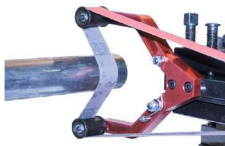
Position de travail Working position