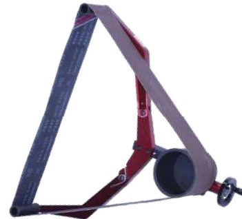
MST-SBH 4.0 EX