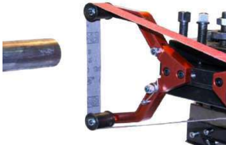
Position initiale Initial position