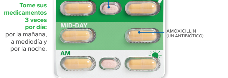
Las pastillas no se muestran en su tamaño real.

Tratamiento de 14 días que se puede tomar con o sin alimentos