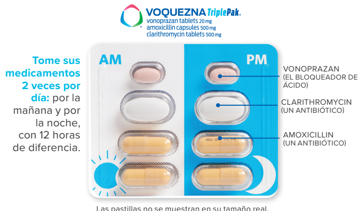
Las pastillas no se muestran en su tamaño real.

Tratamiento de 14 días que se puede tomar con o sin alimentos