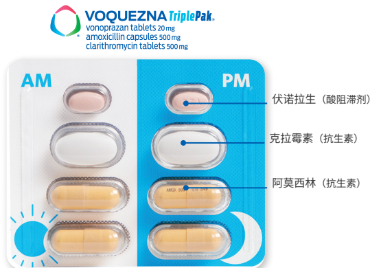
所示药片非实际尺寸。