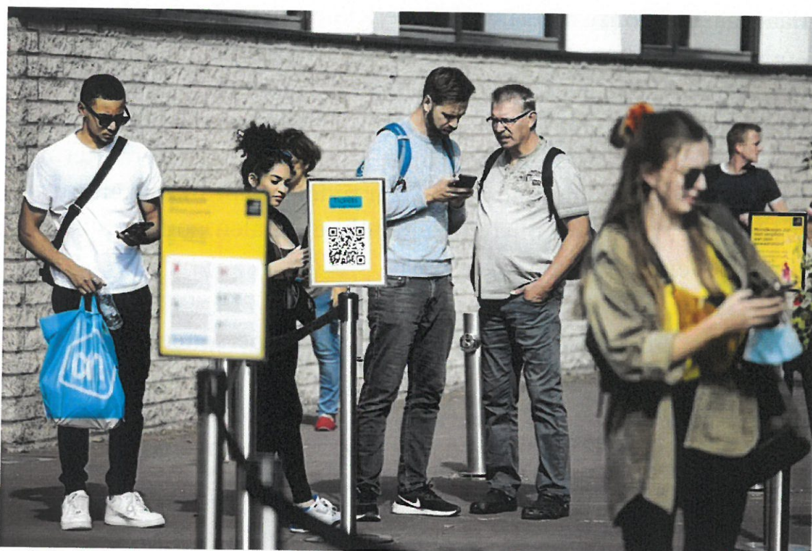
Bezoekers bij het Van Gogh Museum in Amsterdam met hun mobiele telefoon voor de ingang.