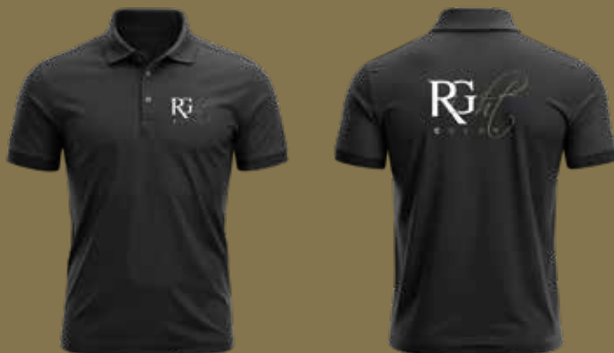
Right Color POLO