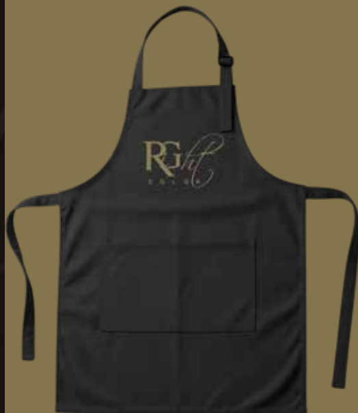
Right Color GREMBIULE