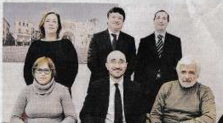
La presentazione in Broletto degli eventi culturali di San Bassiano Borolo