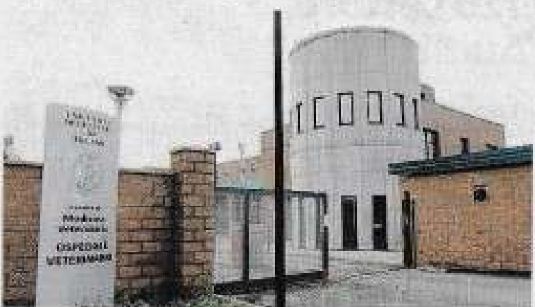
Qui sopra e a lato due luoghi che sarà possibile visitare il 19 gennaio

più di vent'anni fa, raccoglie oltre 150 opere realizzate da autori del territorio, dai celebri Piazza fino agli autori contemporanei come Ugo Maffi, Teodoro Cotugno ed Enrico Suzzani.