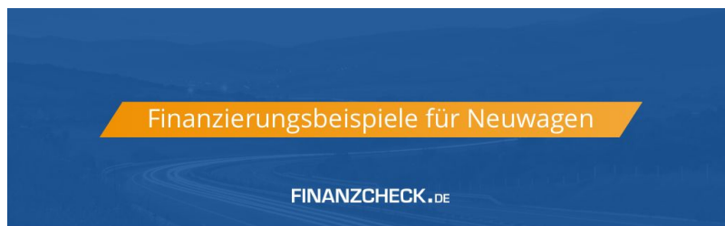
Finanzierung eines VW Polo mit 15.000 € über 5 Jahre

Der tschechische Hersteller ist an der Saar eine begehrte Automarke für die Kfz-Finanzierung. Bei Ehepaaren in den Dreißigern mit Wohneigentum steht Skoda hoch im Kurs: Mit 32% der Kfz-Finanzierungen in der Altersgruppe 30-39 macht die Marke den größten Anteil in dieser Altersklasse aus. Über 58% aller Skoda Finanzierer sind verheiratet und leben größtenteils in den eigenen vier Wänden (48%).